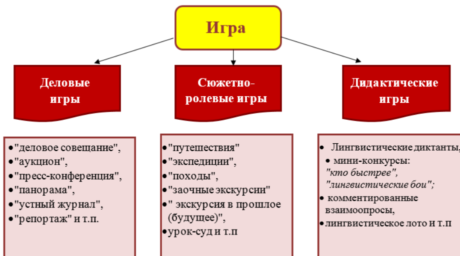
Рис. 2. Виды игры.

Социализирующие: приобщение к нормам и ценностям общества; адаптация к условиям среды; саморегуляция; обучение общению, психотерапия.