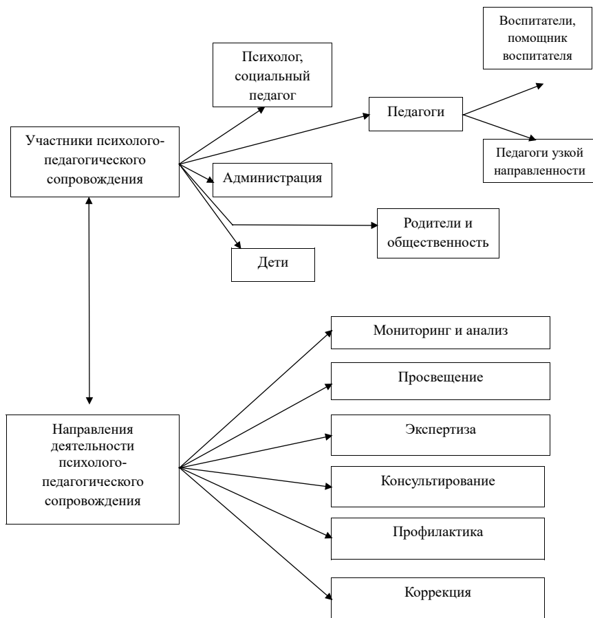
Схема психолого-педагогического сопровождения семей с детьми раннего возраста